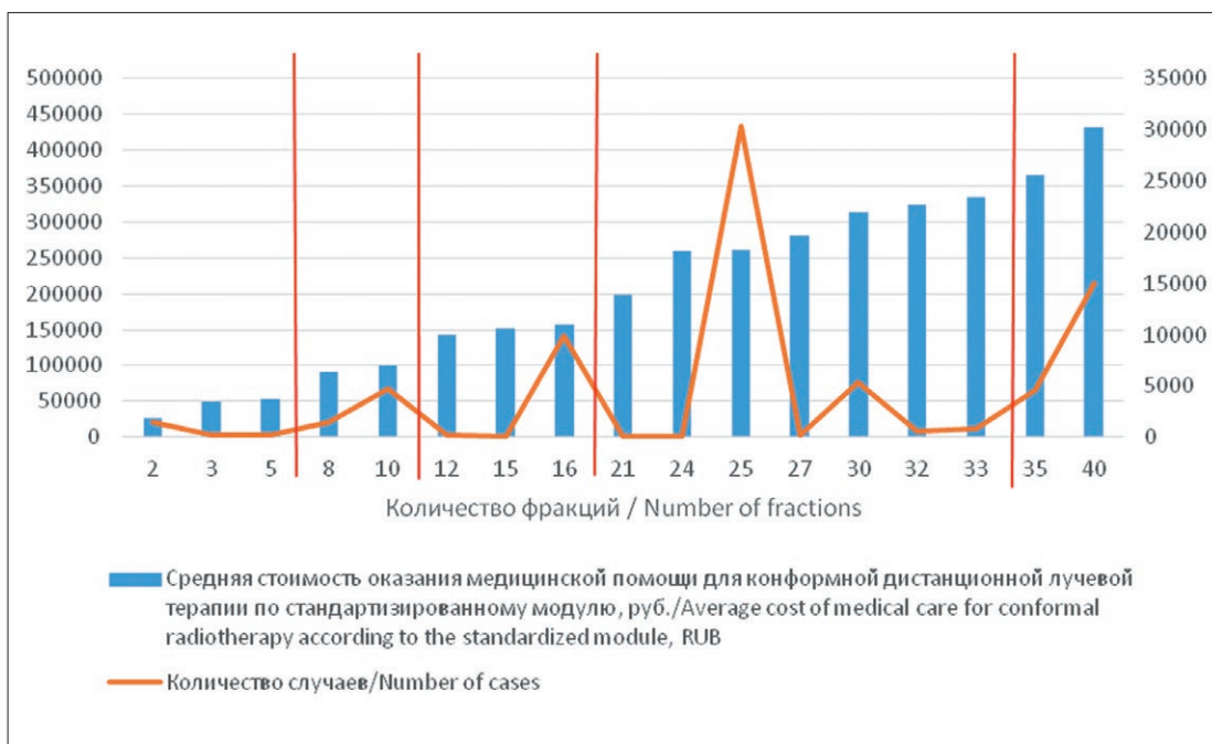
Рис. 2. Определение подгрупп методов лучевой и химиолучевой терапии на примере конформной дистанционной лучевой терапии, проводимой в условиях круглосуточного стационара Fig. 2. Determination of the subgroups of radiotherapy and chemoradiotherapy methods by the example of conformal external-beam radiotherapy conducted in a full-time hospital

IMRT – лучевая терапия с модулированной интенсивностью / intensity-modulated radiation therapy IGRT – лучевая терапия с визуальным контролем / image-guided radiation therapy VMAT – ротационное объемно-модулированное облучение / volumetric modulated art therapy